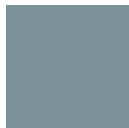
湊鼠 みなとねずみ