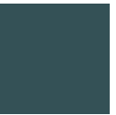
高麗納戸 こうらいなんど