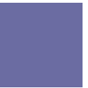
藤納戸 ふじなんど